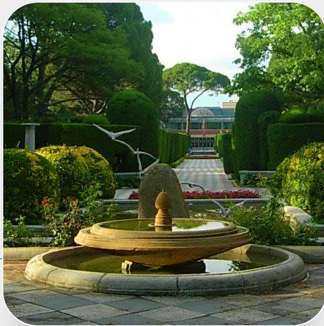
La Fuente de las Gaviotas